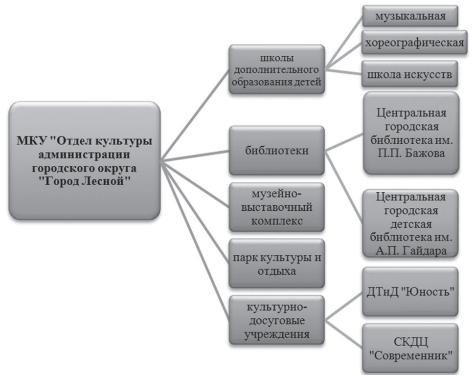
Рис. 3 Структура учреждений культуры городского округа «Город Лесной»

С 1962 года в городском округе работает своя студия телевидения, с 1950-х годов существует свое радио. В структуре МКУ «Отдел культуры» работают 9 учреждений культуры.