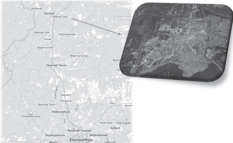
Рис. 1 Схема расположения городского округа «Город Лесной»

Ближайший аэропорт «Кольцово» находится в городе Екатеринбурге на расстоянии 250 километров от городского округа «Город Лесной». «Кольцово» является крупнейшим региональным российским воздушным портом, состоящим из двух терминалов (международного и внутреннего), которые вместе обеспечивают пропускную способность более 2 600 пасс/час.