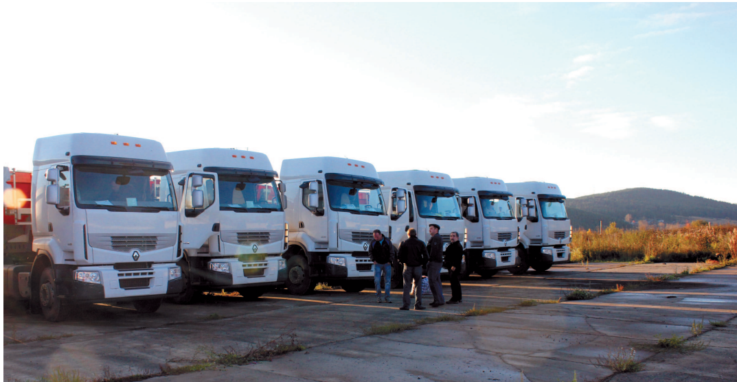
Комиссия придирчиво осматривала каждого новобранца.