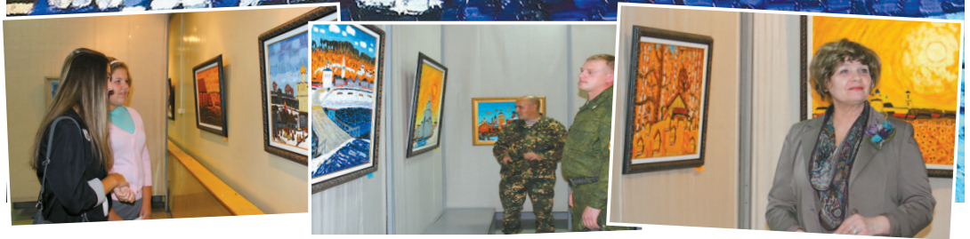
На снимках: Работа К. Бритова «Снег выпал»; на открытии выставки.

Я с трудом пробираюсь сквозь серость и промозглость первых осенних дней. Я спешу спрятаться от сиротливого сентябрьского неба под каменным сводом городской библиотеки имени Бажова, ведь именно здесь меня ждёт поистине долгожданная встреча с прекрасным.