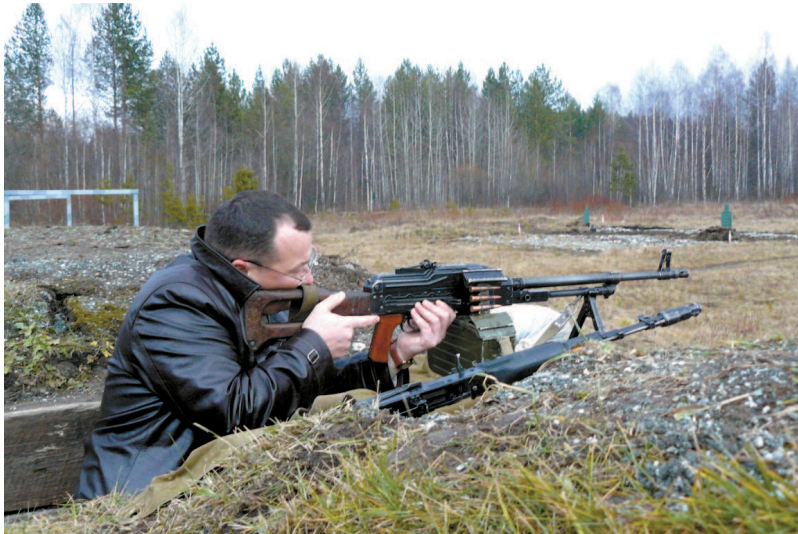
Тренировка в меткости

казарме: у нас и драки бывали. Зато теперь, сколько бы лет ни прошло, мы не теряем связь друг с другом. Слишком много пройдено вместе.