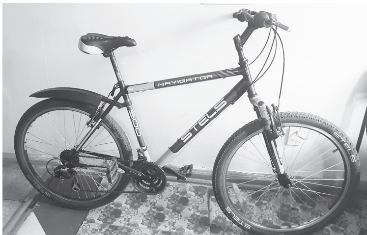
Не оставляйте велосипед без присмотра

ин велосипеда не находился дома около месяца, то точную дату кражи указать не смог. Оперативным путем удалось установить похитителя. Им оказался житель Лесного, ранее уже привлекавшийся к уголовной ответственности. Он не только похитил данный велосипед, но даже успел его продать.