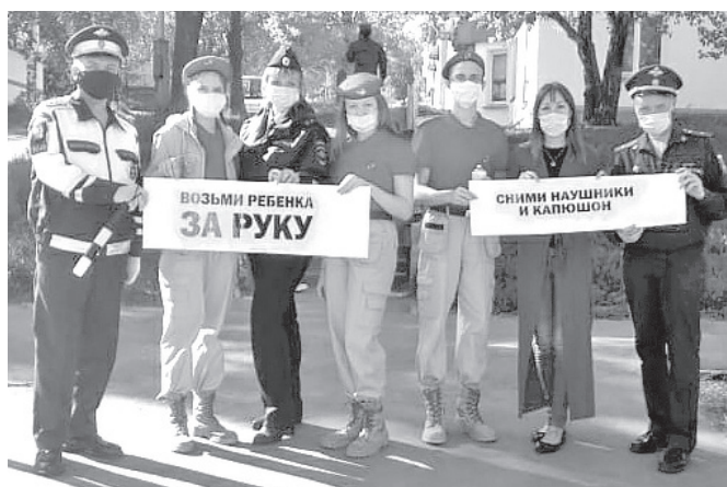
Участники мероприятия «Внимание – дети!»

Е. ВАРЛАМОВА, ИНСПЕКТОР ПО ПРОПАГАНДЕ БДД ОГИБДД ОМВД РОССИИ ПО ГО «ГОРОД ЛЕСНОЙ»