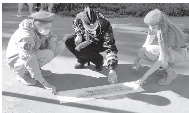
«Следы»-памятки для пешеходов теперь есть в п. Горный