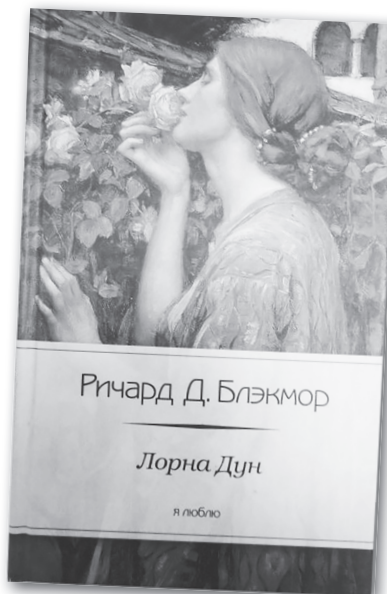
Ричард Д. Блэкмор Лорна Дун в любви

Перед нами классический любовный приключенческий роман: прекрасная героиня Лорна Дун с высоким титулом и загадочным прошлым, простоватый главный герой фермер Джон Рид без титулов и богатств, но зато невероятно добрый и справедливый. Вроде бы и добродушный богатырь, но в то же время знает Шекспира, и в большом городе не теряет головы. Людей-разбойники, не лишённые, однако, некоторого благородства, а также весьма колоритные второстепенные персонажи в лице матери главного героя, ревнующей его к невесте, его младших сестер, одна из которых, Анни, добрая, но невероятно глупая (и при этом все в ней души не чают!), вторая, Лиззи, очень умная