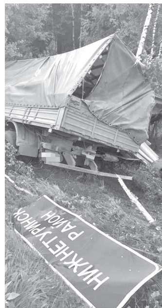
ДТП произошло 29 мая

ПО ИНФ. ГИБДД г. Нижняя Тура