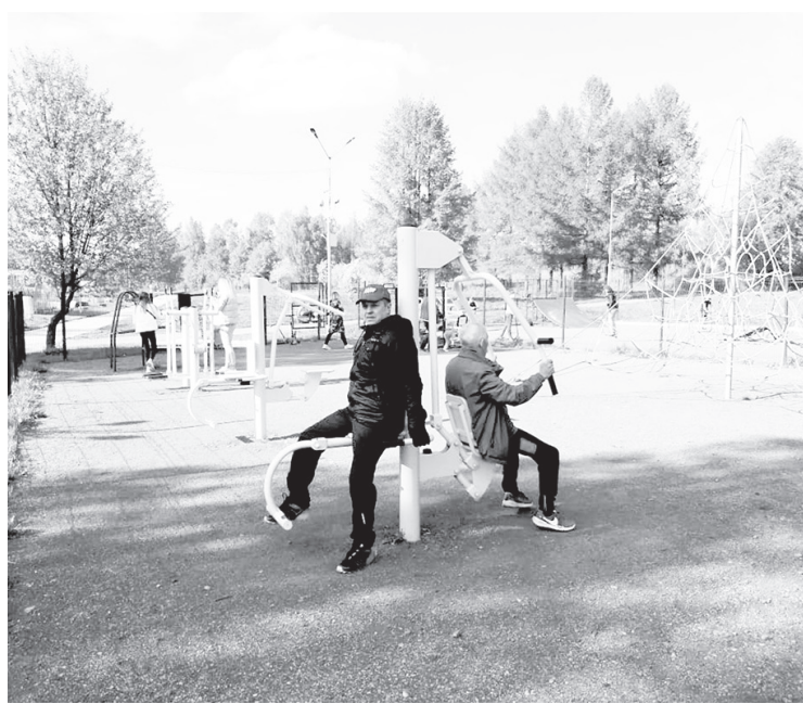
Молодому поколению есть с кого брать пример

лезкрана борются со всем этим беспределом. Здесь с интровертами всё ясно: самоизоляция для них — не приговор. А вот как быть с экстравертами? Они по своей природе общительный народ, им необходимы прямые контакты, движение, физические нагрузки и отсутствие этих составляющих для них — катастрофа. Всё это касается круга моих знакомых, как принято говорить, ведущих здоровый образ жизни. Тогда, в прошлой жизни, у них всё шло по накатанному: зимой — лыжи, летом — велосипед, пробежки и обязательно — занятия на тренажёрах, которые расположены в разных местах города. В настоящее время всё это позакрывалось, и наступили тя-