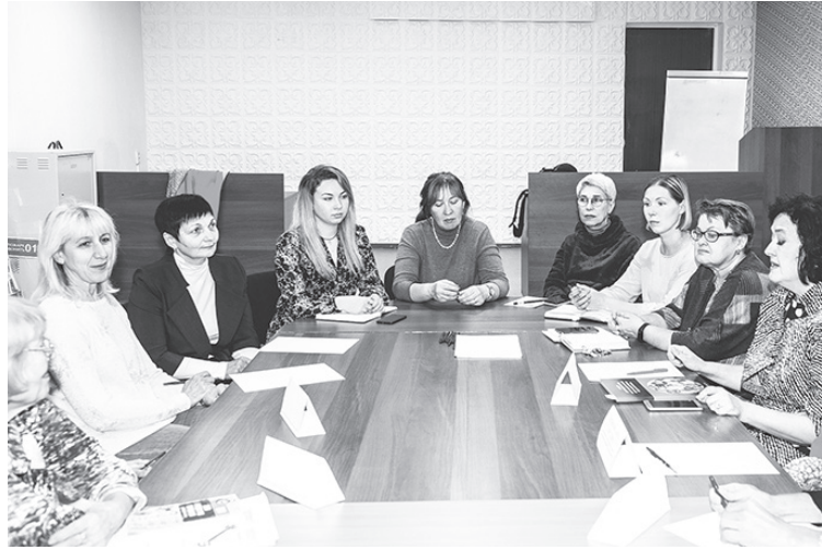
За круглым столом заинтересованные лица, включая представителей малого бизнеса

Ветераны отрасли предлагают и сегодня проводить системное обучение кадров, приходящих в сферу потребительского рынка, диалоги с надзорными органами, ветеранами и бизнесменами, особенно начинающими. Так, Ма-