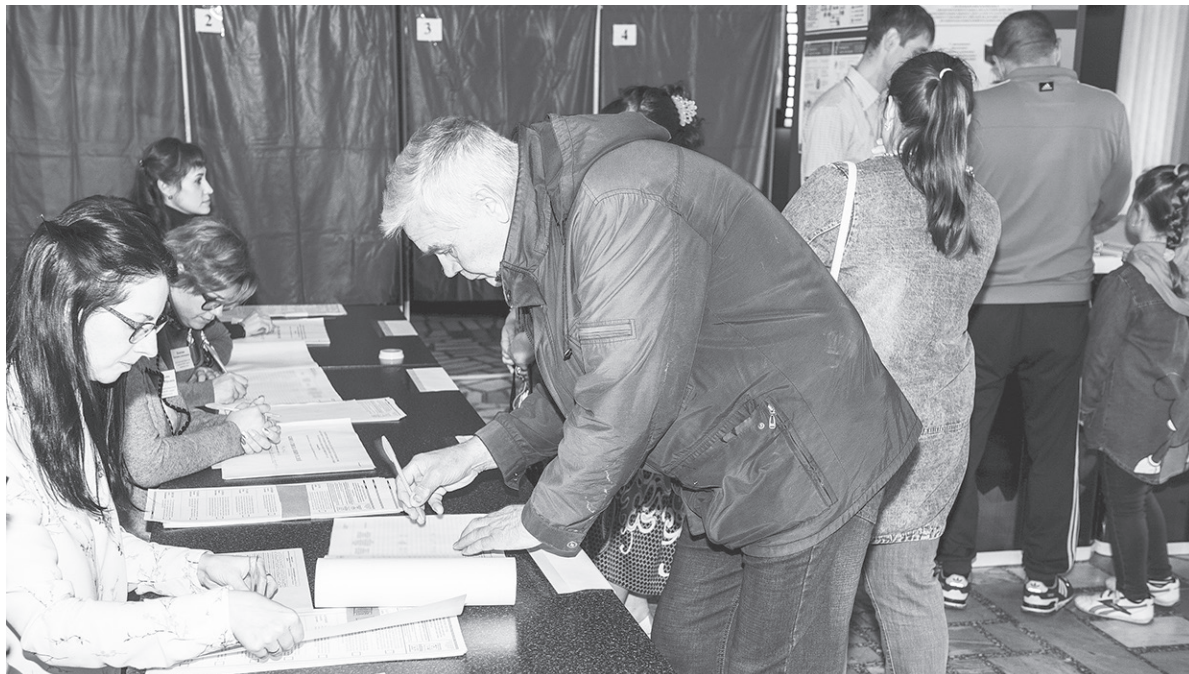
Фрагмент регистрации и выдачи бюллетеней для голосования на избирательном участке № 609 (клуб «Луч», г. Нижняя Тура)

Безусловно, Антон Шипулин был фаворитом. Его избирательный фонд втрое превысил траты всех участников предвыборной гонки вместе взятых — более 10 млн руб. Ему помогли и однопартийцы, занимающие руководящие должности во всех муниципалитетах округа — пресловутый админресурс. Даже Областной суд с пониманием отнёсся к «единороссу» и простил ему нарушения в финансовой отчётности. Поэтому 8 сентября Антон Шипулин получил 41,6% голосов избирателей, принявших участие в выборах. Явка при этом была невысокой — 24,8%. Как и прогнозировал «Резонанс», власти не стимулировали граждан к участию в выборах. В итоге 46 тыс. голосов, отданных за «единоросса» в полумиллионном округе, вполне хватило, чтобы он получил мандат депутата Госдумы.