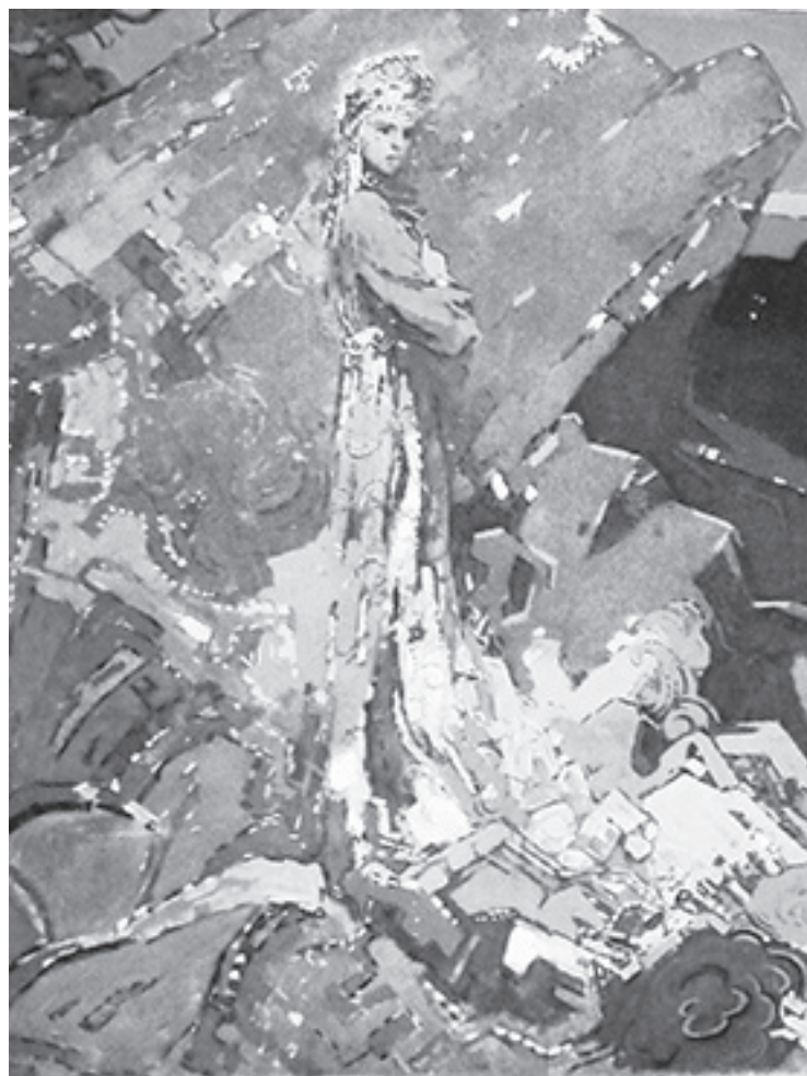
Фрагмент росписи в ЦДТ (центре детского творчества)