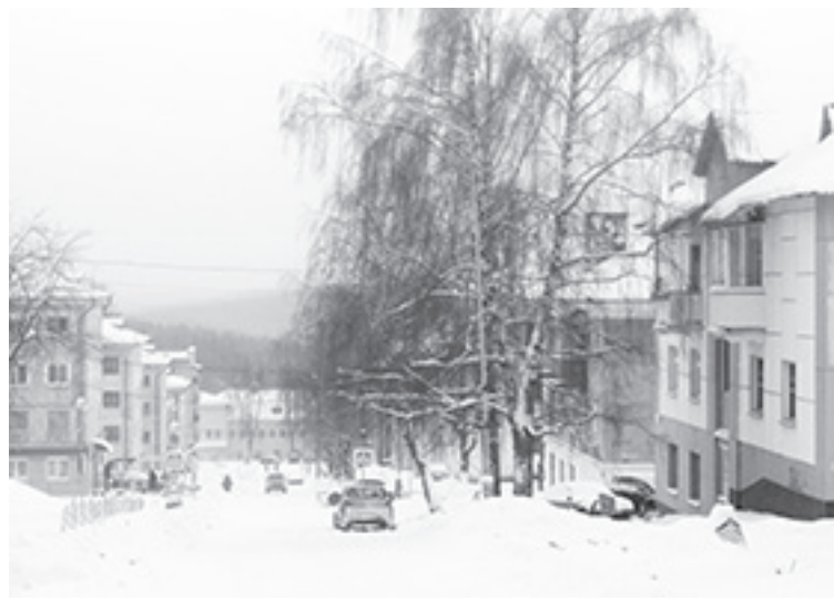
Улица Бажова в посёлке Горном