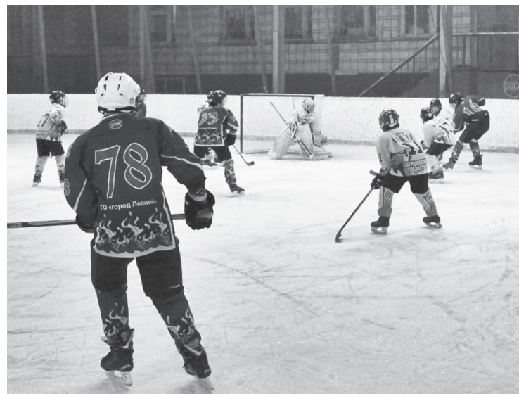
Лесничане атакуют ворота краснотурьинцев