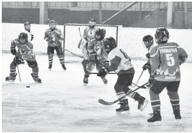
Момент игры «Факел» — «ДЮСШ»

Игра с самого начала шла с взаимными шансами. Первой успеха добилась наша первая пятёр-