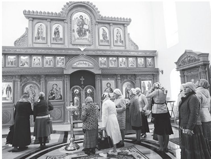
В женском монастыре преподобномученицы Елизаветы

17 паломников увидели старинные городские здания и сооружения бывшего железодобывающего завода. Они побывали и в величественном Свято-Троицком соборе, который был построен в 1702 году. Он знаменит своими святынями: образом Божией Матери «Августовская» (икона написана в честь явления Божией Матери в 1914 году русским солдатам), мощами преподобномученицы Елизаветы Фёдоровны и святых земли русской, склепом, где пребывали гробы с телами Великокняжеских мучеников семьи Романовых после их поднятия из шахты в 1918 году. Паломники стали свидетеля-