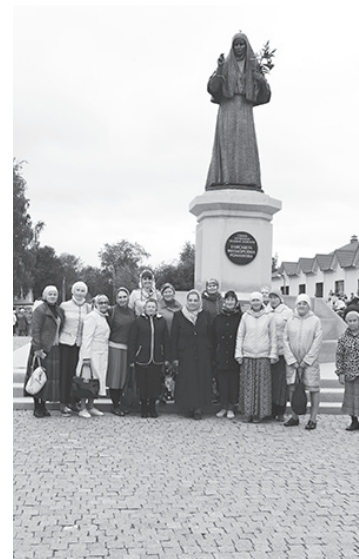
У памятника святой преподобномученицы Елизаветы

ми торжества и красоты Елизаветинского бала, ежегодно устраиваемого на площади, рядом с возведённым памятником Великой княгине Елизавете.