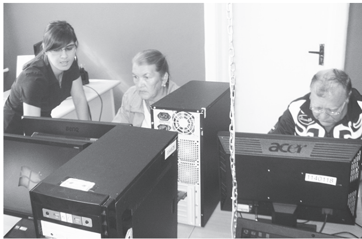
Основы компьютерных знаний необходимы и пожилым людям