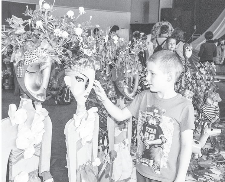
Выставка привлекла внимание молодёжи Лесного