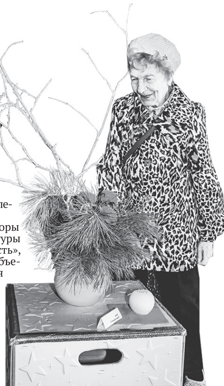
Букеты в стиле 3D тоже нашли своего зрителя

Н. КОЛПАКОВА, редактор отдела культуры г. Лесной