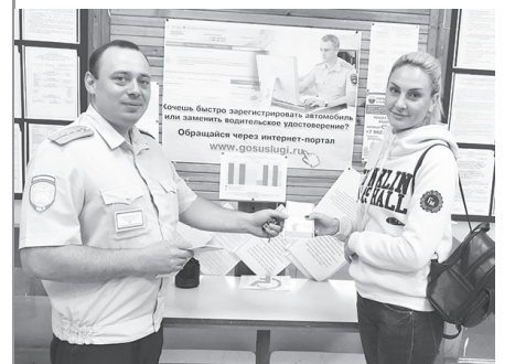
Инспекторы РЭО ОГИБДД г. Нижней Туры напомнили своим посетителям о преимуществах использования Единого портала государственных услуг

Кроме того, имеется мобильная версия сайта, которую можно скачать по ссылке: https://beta.gosuslugi.ru/information/mobile .