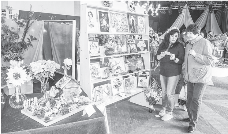
На выставке осенних даров было представлено также и прикладное творчество умельцев из Лесного