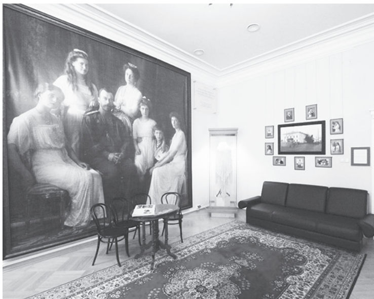
В одной из комнат музея семьи императора Николая II в г. Тобольске

Этот маршрут называется «Императорский». Два вагона 1-го и 2-го класса дают примерное представление о том, как и в каких вагонах ездил царская семья. Кресла обиты красной тканью, есть откидной столик, подставка для обеих ног — очень удобно: ставишь их на такую подставку, чтобы не очень уставали. Ехали до Тобольска четыре часа. В салоне вагона установлен монитор, по которому всю дорогу показывают документальные фильмы про прошлое России времён царствования Николая II. Но показывают всё без звука. В кресла вмонтированы розетки, и у кого есть свои наушники, могли посмотреть фильмы со звуком. Если с собой наушников нет, то их можно купить у проводника, а по прибытии в Тобольск сдать. К вашим услугам чай, кофе, печенье и т.д. Природа по пути следования поражает красотой. Опять же кругом чистота, нигде не увидела мусора.