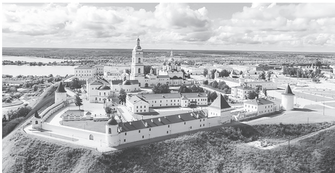
Тобольский кремль был построен в 1587 году — это единственный каменный кремль в Сибири

Итак: мы доехали до Байкалово — это граница Свердловской и Тюменской областей. Заезжая на Тюменьщину, чувствуешь разницу. Я вот почувствовала там наличие Хозяина и поразилась чистотой. Много деревень и посёлков, одноэтажные дома, крытые черепицей, есть приусадебные участки. При въезде в Тюмень на развилке дорог разбит большой цветник, область встречает гостей цветами! Сколько мостов и этот огромный цветник! Спасибо, тюменцы, это здорово! Это называется гостеприимством, мол, «Приезжайте к нам в Тюмень!», а в ней есть на что посмотреть. Много церквей, старинных домов с красивой архитектурой, и их стараются реставрировать. Незабываемый ансамбль старины и современности. Высотных домов не строят — максимум 9-этажные, и обязательно выделен участок земли под детскую площадку и отдых пожилых людей. Да, Хозяин здесь чувствуется во всём, и чистота налицо. Я настолько была удивлена, что даже не сразу поверила, что так может быть. По чистоте Тюмень, наверное, единственный такой город в России. Это моё субъективное мнение. Автовокзал в Тюмени один, и он тоже мне очень понравился. Выйдя из него на остановку, заметила стенд, на котором отражены достопримечательности города, а их очень много. В Тюмени нет метро, и никогда не было трамваев. Курсировали троллейбусы, но чasto