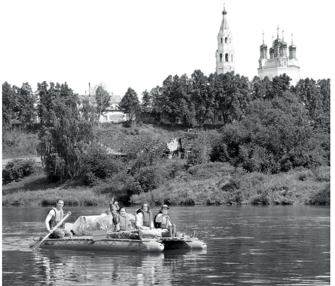
Это чудо — под куполами Кремля Верхотурья!