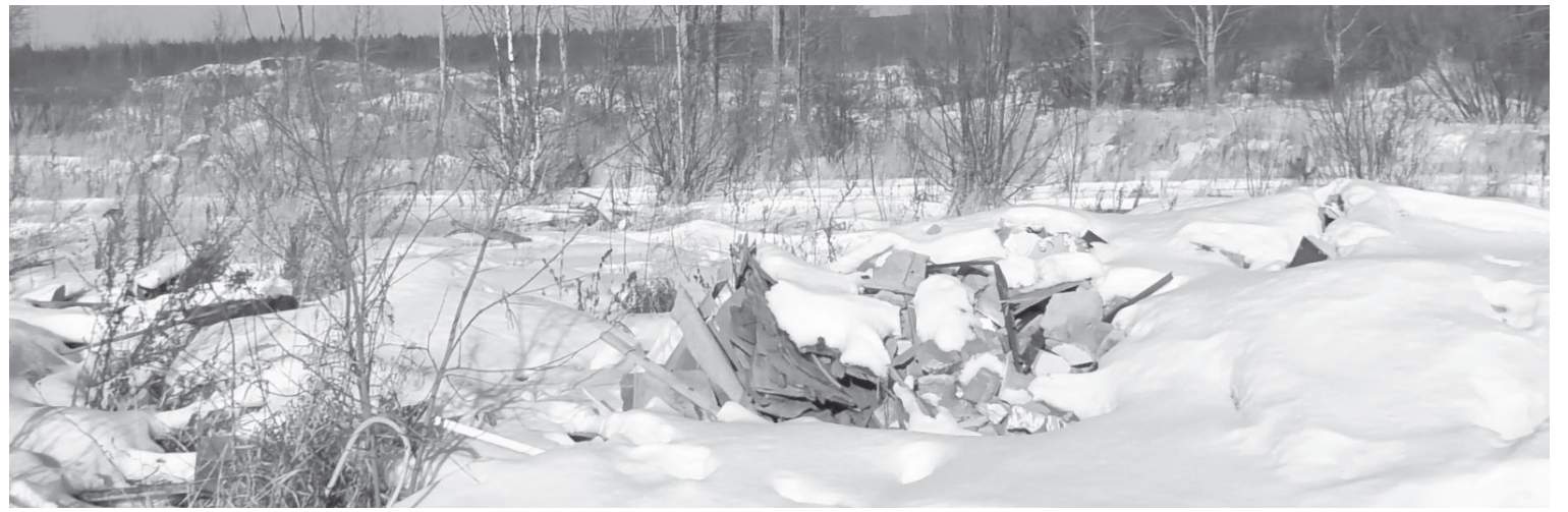
Несанкционированная свалка в районе зольного поля