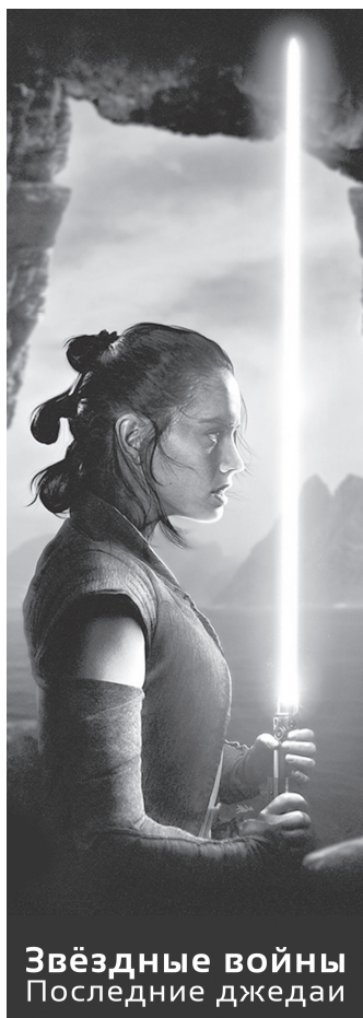
Звёздные войны Последние джедаи

С 17 декабря по 5 января Невьянский государственный историко-архитектурный музей приглашает на мероприятие «Демидовская ёлка».