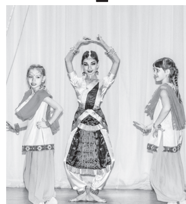
Творческий подарок от юных артистов

ского Дворца культуры состоялся праздничный концерт, посвящённый нижнетуринцам с ограниченными физическими возможностями. На сцену центра культуры в этот день вышли представители творческих коллективов ДК, подарив нашим инвалидам музыкальные поздравления. Зрители тепло встречали каждое выступление, ведь не так часто у них бывает возможность посмотреть такой прекрасный концерт. И отрадно, что покидали они зрительный зал в хорошем настроении, значит, не зря старались артисты, получив в награду за свой талант и труд бурные аплодисменты участников торжества. Видеть радость в