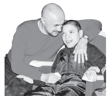
В зале царил тёплая атмосфера

ского Дворца культуры состоялся праздничный концерт, посвящённый нижнетуринцам с ограниченными физическими возможностями. На сцену центра культуры в этот день вышли представители творческих коллективов ДК, подарив нашим инвалидам музыкальные поздравления. Зрители тепло встречали каждое выступление, ведь не так часто у них бывает возможность посмотреть такой прекрасный концерт. И отрадно, что покидали они зрительный зал в хорошем настроении, значит, не зря старались артисты, получив в награду за свой талант и труд бурные аплодисменты участников торжества. Видеть радость в