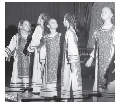
«С праздником, дорогие мамы!»