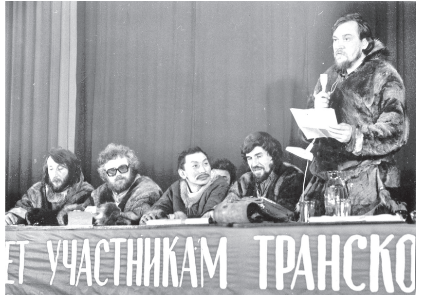
На встрече с жителями Булунского района Якутии.