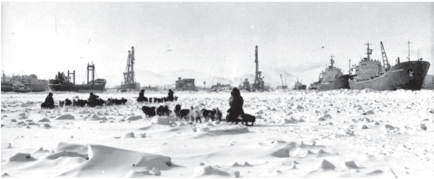
Среди льдов.

В ГОД, КОГДА ЗАКРЫТЫЙ ЛЕСНОЙ ОТМЕЧАЛ СВОЁ 35-ЛЕТИЕ, СТАРТОВАЛА ШИРОКО ОСВЕЩАВШАЯСЯ В СТРАНЕ ПОЛЯРНАЯ ЭКСПЕДИЦИЯ ГАЗЕТЫ «СОВЕТСКАЯ РОССИЯ» (1982-1983). ТОГДА О НЕЙ СООБЩАЛИ МНОГОЧИСЛЕННЫЕ СРЕДСТВА МАССОВОЙ ИНФОРМАЦИИ, СИМВОЛИКА РАЗМЕЩАЛАСЬ НА ПОЧТОВЫХ КОНВЕРТАХ, ИЗГОТОВЛИВАЛИСЬ ПАМЯТНЫЕ ЗНАЧКИ. А В НЫНЕШНЕМ, 2017-М, ИСПОЛНИЛОСЬ 35 ЛЕТ НАЧАЛУ САМОЙ ЭКСПЕДИЦИИ.