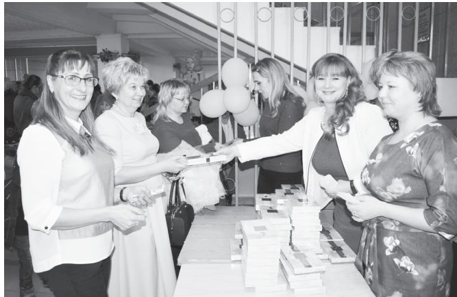
День матери - 2017, работает комиссия ПК-391

В МИНУВШУЮ ПЯТНИЦУ КОМИССИЯ ПК-391 ПО РАБОТЕ С СЕМЬЕЙ, ПОД ПАТРОНАТОМ ЕГО ШТАТНЫХ СОТРУДНИКОВ, ПРОВЕЛА ТРАДИЦИОННОЕ ЧЕСТВОВАНИЕ МАМ, СОТРУДНИЦ КОМБИНАТА «ЭХП», В КАНУН ДНЯ МАТЕРИ, ОТМЕЧАЕМОГО В ПОСЛЕДНЕЕ ВОСКРЕСЕНЬЕ НОЯБРЯ. ЭТО МЕРОПРИЯТИЕ СТАЛО УЖЕ ТРАДИЦИОННЫМ И ПРОВОДИТСЯ С ПОМОЩЬЮ УЧРЕЖДЕНИЙ КУЛЬТУРЫ ЛЕСНОГО.