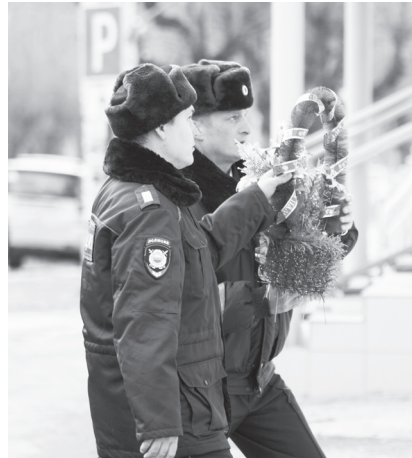
Возложение цветов к памятной доске сотрудникам отдела, погибшим при исполнении служебного долга