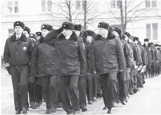
Парадным строем к отделу МВД