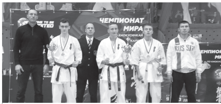
Участники турнира с Яковом Зобнинным и чемпионом мира Евгением Мамро

ВСЕ БЛИЖЕ ОТКРЫТЫЙ ЧЕМПИОНАТ МИРА ПО КИОКУСИНКАЙ КАРАТЭ, ЧТО ПРОЙДЕТ В ЕКАТЕРИНБУРГЕ, И РУКОВОДСТВО РЕГИОНАЛЬНОЙ ФЕДЕРАЦИИ ПОД РУКОВОДСТВОМ АНДРЕЯ ВЛАДИМИРОВИЧА БУРЫ, КОТОРЫЙ ВОЗГЛАВИТ СБОРНУЮ РОССИИ НА ЧЕМПИОНАТЕ МИРА — 2017, ПРИКЛАДЫВАЕТ ОГРОМНЫЕ УСИЛИЯ ДЛЯ ПОДГОТОВКИ ЭТОГО ГРАНДИОЗНОГО МЕРОПРИЯТИЯ.