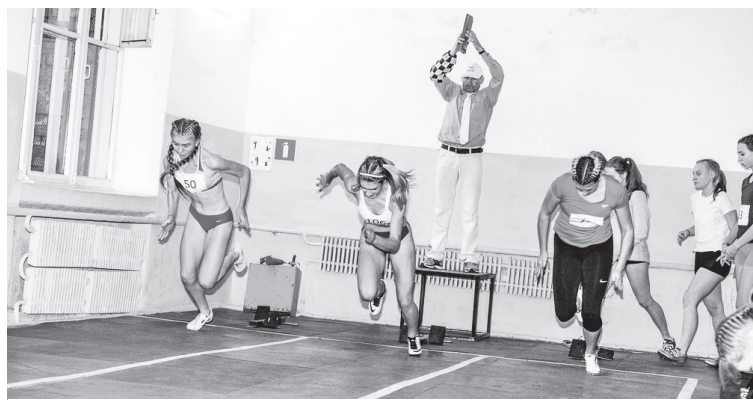
Старт забега на 60 м.