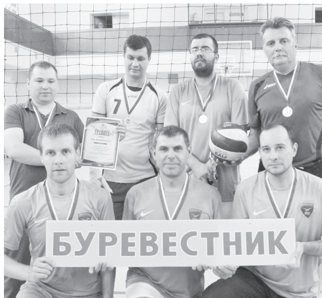
Победил «Буревестник».

Матчи финальной стадии начались 2 октября встречей за 5-6 места, в которой «Конструктор» легко справился с «Чайкой» 2:0 (25:8, 25:10). А «финал четырех» начался встречей «Витязь» — «Калибр». После упорной первой партии, которую «Витязь» с большим трудом выиграл, вторая партия далась команде 440-го в/п намного легче — 2:0 (25:23, 25:15). В матче «Авангард» — «Буре-