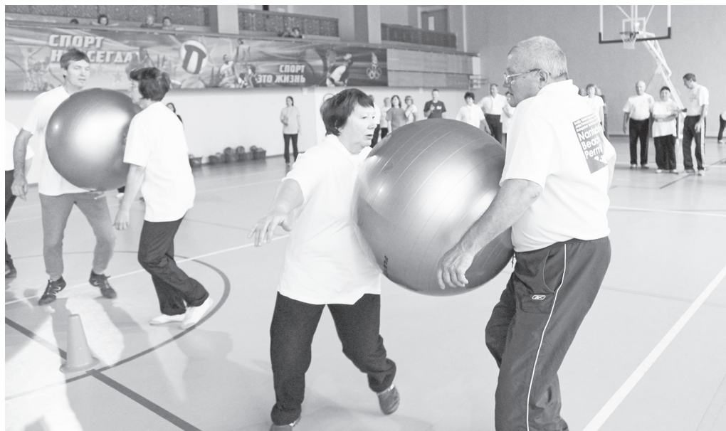
Не всё так просто, как кажется.