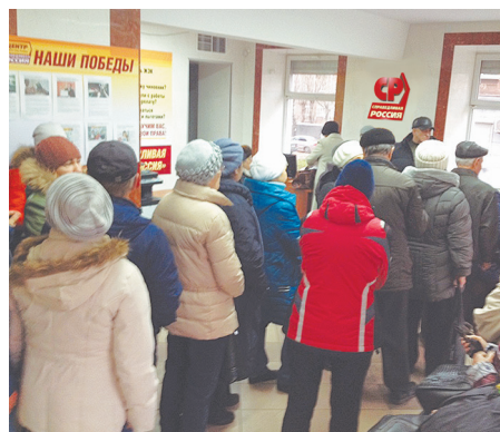
Узнав о возможности перерасчета пенсии, тагильчане выстроились в огромную очередь возле приёмной «Справедливой России»

После потока обращений Пенсионному фонду пришлось отправить в нашу приемную своего специалиста, который делал перерасчет прямо на месте. Более 5000 пенсионеров получили надбавку до 2 тысяч руб. ежемесячно!