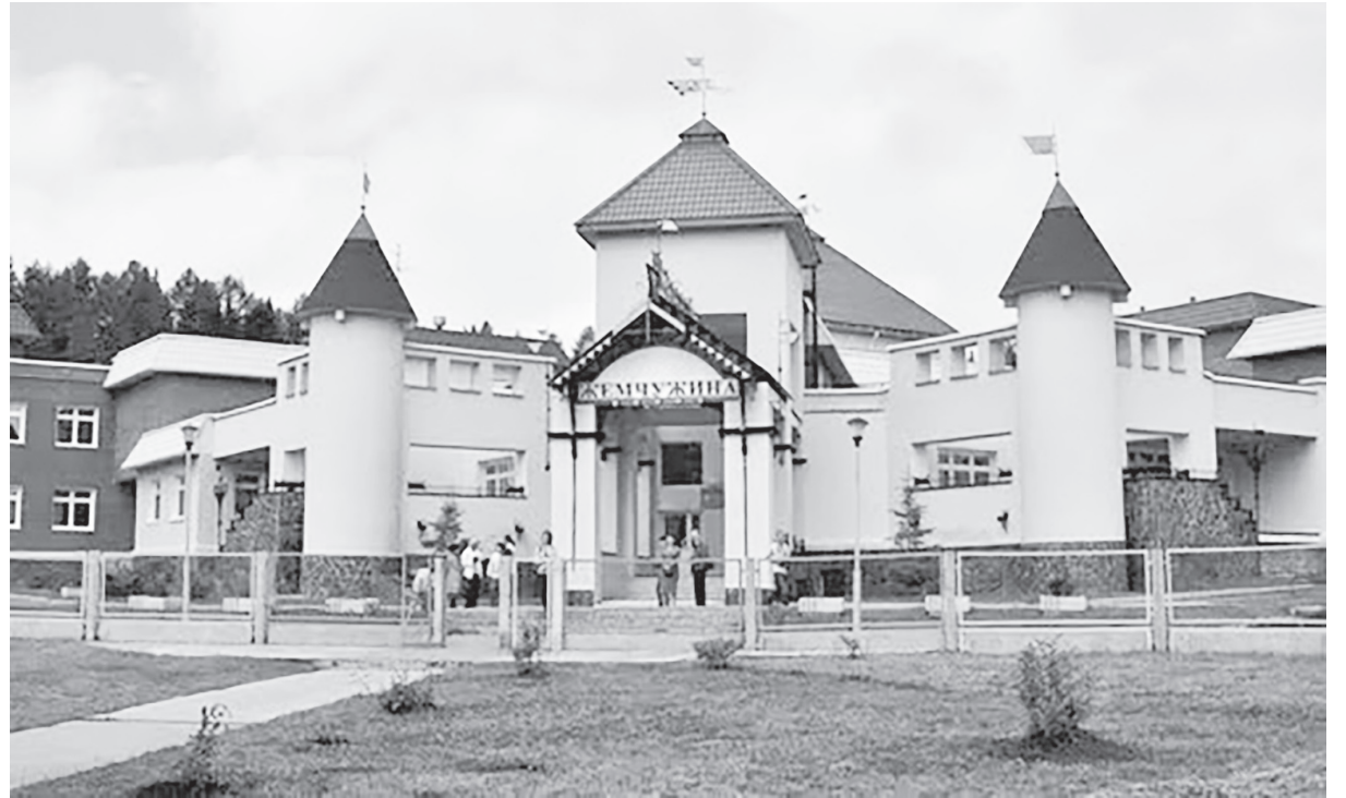
Детский сад «Жемчужина»

С развитием градообразующего предприятия параллельно рос и развивался город: строилось жильё, школы, объекты культуры, бытового обслуживания, постепенно создавалась вся инфраструктура города. Особое место в развитии города принадлежит руководителям —