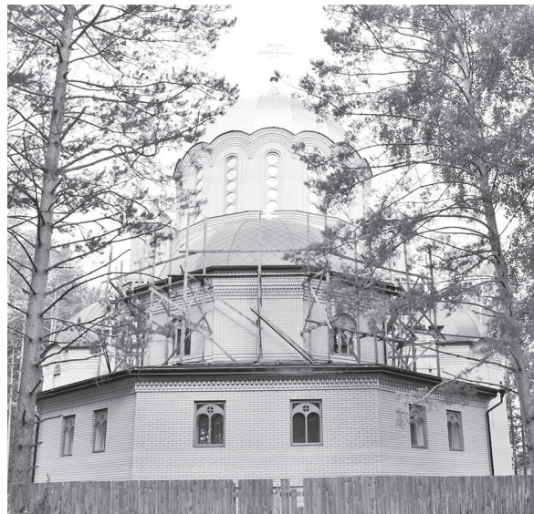
Идет строительство нового храма.

Тогда, в самый разгар братоубийственной войны, здесь большевиками были казнены князь и княгиня царской крови. Случилось это на следующую ночь после расстрела царской семьи в подвале Ипатьевского дома в Екатеринбурге. К Алапаевску в то время приближались белогвардейцы. Ночью высокопоставленных особ, содержащихся под арестом в здании Напольной школы в Алапаевске, разбудили. Под предлогом перевода узников на Верхне-Синячихинский завод им связали руки, завязали глаза и, посадив на повозки, повезли к северу от Алапаевска. Несмотря на ночное время, нашлись очевидцы, видевшие процессию. Наверняка князь догадывались, для какой цели их везут. Лошадей остановили в тёмном лесу около заброшенной шахты, арестантов подвели к зияющему в земле отверстию. Вот их имена: — великая княгиня Елизавета Фёдоровна Романова; — великий князь Сергей Михайлович;