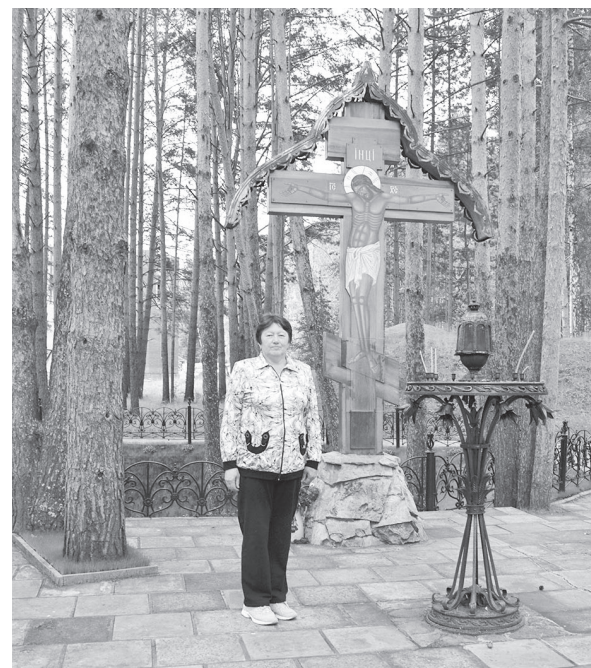
У Поклонного креста на месте гибели князей Романовых.

Наверняка многие нижегородцы побывали на территории монастыря на Ганиной Яме. Посетите и место близ села Нижняя Синячиха, где расположен монастырь во имя Новомучеников Российских. Наверняка этим вы обогатите свои знания и душу, прикоснувшись к святому. Вдыхая особый, насыщенный хвоей воздух, в тени здешних сосен, особенно остро ощущаешь всю несправедливость произошедшей здесь трагедии, забывая которую мы не имеем права.