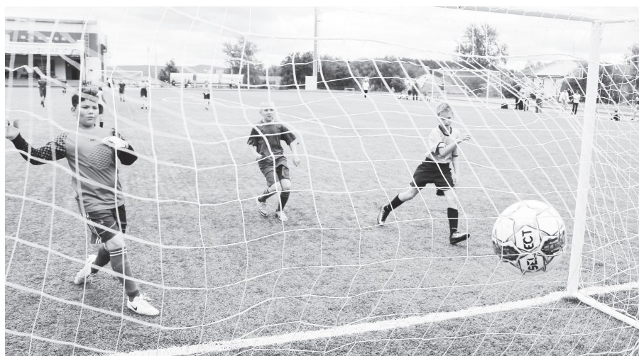
Нижняя Тура забивает мяч в ворота Баранчи.

Весомость выигрыша подтвердила следующая игра, в которой «Синегорец» забил «Лобве» 17 безответных мячей. Но, понятно, собравшихся го-