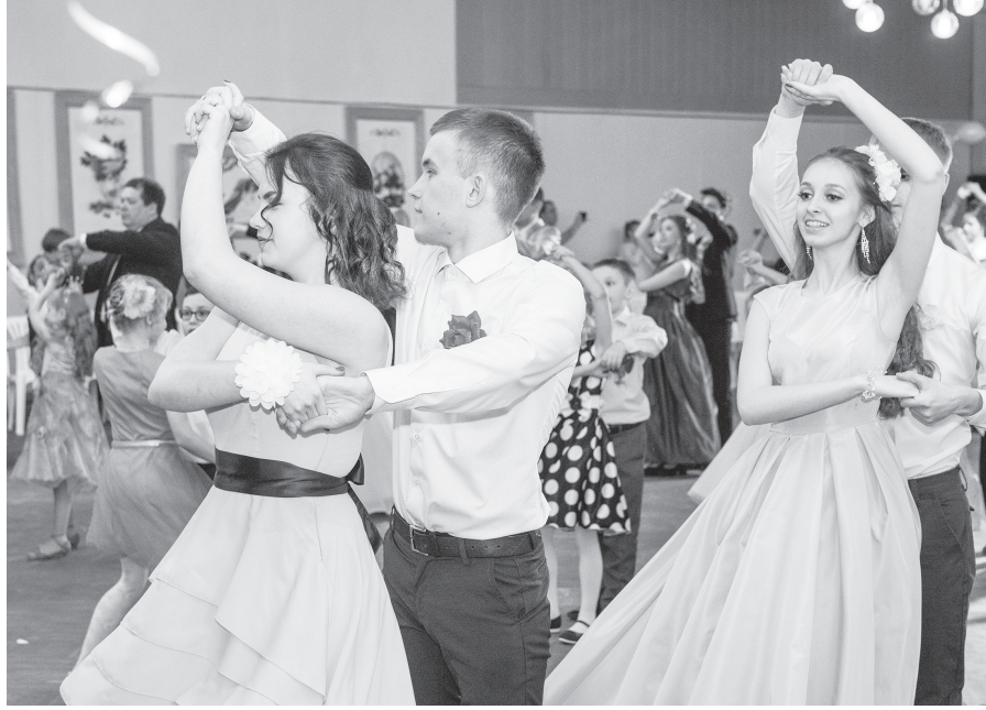
Блистательные участники «цветочного» бала.

«Добрый день, уважаемые гости! Мы рады приветствовать всех вас на нашем „Королевском весеннем балу“. Весна — замечательная пора, когда вся природа оживает. И в нашем „королевском“ саду распускаются самые красивые, самые яркие цветы, и именно поэтому мы ре-