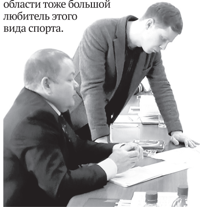
Во время приёма.