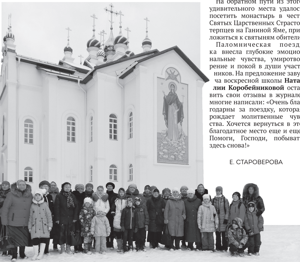
Группа нижнетуринцев совершила паломничество в Среднеуральский женский монастырь «Спорительница хлебов».

Это Среднеуральский женский монастырь «Спорительница хлебов», который посетили участники «Православного проекта» — воспитанники центра социальной помощи семье и детям, Нижнетуринского детского дома, учащиеся школы № 1, прихожане храма во имя святителя Иоанна Митрополита Тобольского. Чтобы паломники лучше почувствовали атмосферу святого места, в автобусе был показан документальный фильм «Обитель веры и любви». Все, чья жизнь так или иначе связана с монастырем, объясняют секрет духовности этого удивительного места, места любви ко всем, кто ищет помощи и поддержки.