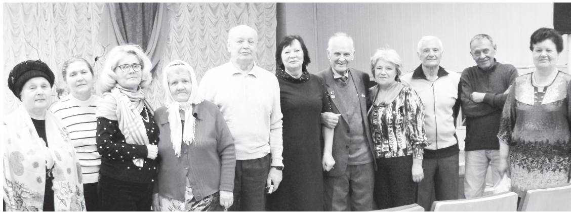
После встречи.

ПРОДОЛЖАЕТСЯ МЕСЯЧНИК ЛЮДЕЙ СТАРШЕГО ПОКОЛЕНИЯ, КОТОРЫЕ В ОСНОВНОЙ СВОЕЙ МАССЕ ЖИВУТ АКТИВНОЙ, ТВОРЧЕСКОЙ ЖИЗНЬЮ. ЧЕМ ТОЛЬКО ОНИ НЕ ЗАНИМАЮТСЯ! ПОЮТ, ТАНЦУЮТ, ВЯЖУТ, РИСУЮТ, СОЗДАЮТ СЛАЙД-ПРОГРАММЫ, УЧАСТВУЮТ В КОНКУРСАХ И СПОРТИВНЫХ СОСТЯЗАНИЯХ.