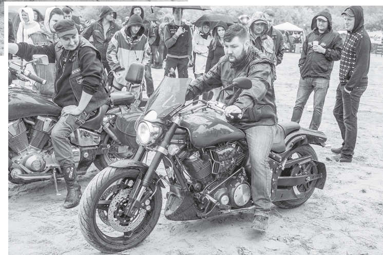
Победитель конкурса на самый сильный рёв мотора.

захстана и Республики Беларусь. Примерно столько же было зрителей. Среди приглашенных в качестве гостей оказались и наши байкеры из Лесного и Нижней Туры. Вся лесопосадка вокруг большой центральной поляны была заставлена байками (мотоциклы байкеров) и палатками. Удивила содержательная и интересная программа фестиваля. В нее вошли: концерт рок-групп, среди которых очень известные в России: «Мара» и «Кукрыниксы», фаер-шоу, показательные боевые выступления спецназа и спортсменов айкидо, традиционные байкерские конкурсы, выставка-соревнования по кастомизингу, замер звукового давления в выхлопной трубе, конкурс тату, соревнования по пауэрлифтингу, шоу авиамоделлистов, гонки по искусственным препятствиям на квадроциклах, церемония награждения по номинациям: «Дальнобой», «Самый молодой байкер», «Самый старый бай-