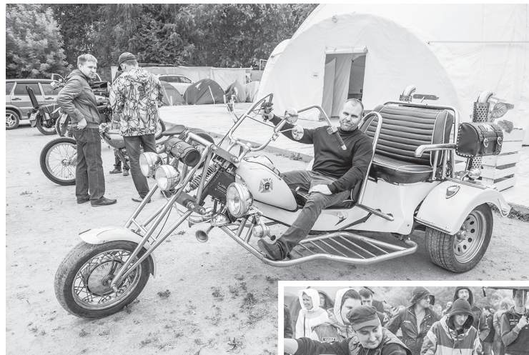
Кастом «Ferdinand», автор Евгений, Челябинская обл., г. Южно-Уральск.

Ко всему этому добавьте шарм байкеров — кожаные жилетки