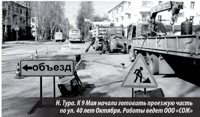
Н. Тура. К 9 Мая начали готовить проезжую часть по ул. 40 лет Октября. Работы ведет ООО «СОЖ»

— Проблема в том, что сам участок дороги от Дворца культуры до гидроузла очень непростой в силу особенностей рельефа. Дорога находится под уклоном и подвержена воздействию внутренних вод, селевых потоков. Прибавляем к этому массовое транспортное движение по ней, а также возможную недобросовестность подрядчиков. Для капремонта бюджетных средств, естественно, не хватает, поэтому пока приходится производить только ямочный ремонт. В прошлом году, в связи с колеиностью дороги по улице Строителей, ГИБДД было сделано предписание по устранению проблемы, и во избежание закрытия дороги на зиму колею мы убрали, срезав верхний слой. А с начала весны возобновили работы по ремонту.