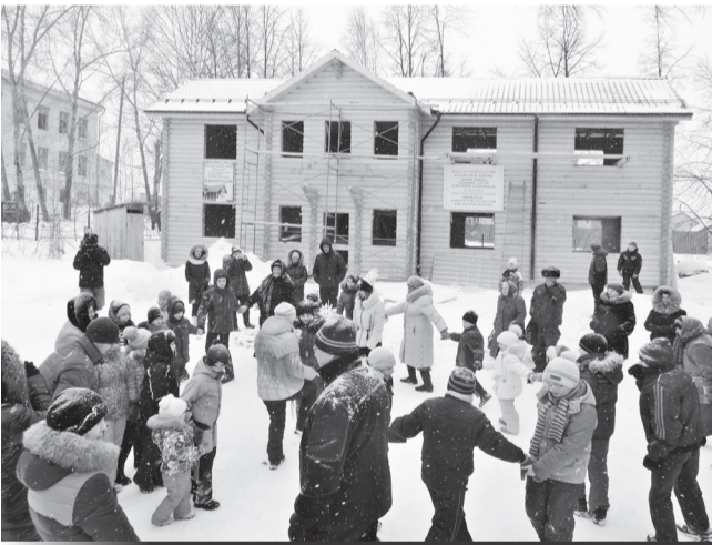
На заднем плане – строящееся здание воскресной школы, г. Нижняя Тура