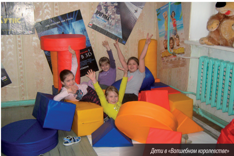
Дети в «Волшебном королевстве»