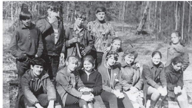
В поход за первыми подснежниками! С любимой учительницей нам везде интересно! 70-е годы XX века