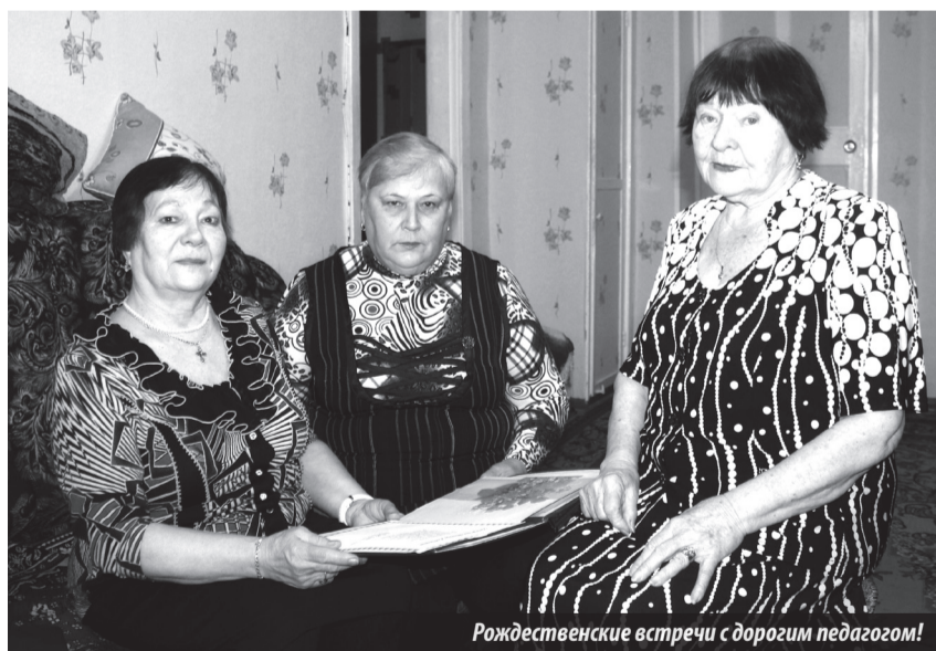
Рождественские встречи с дорогим педагогом!