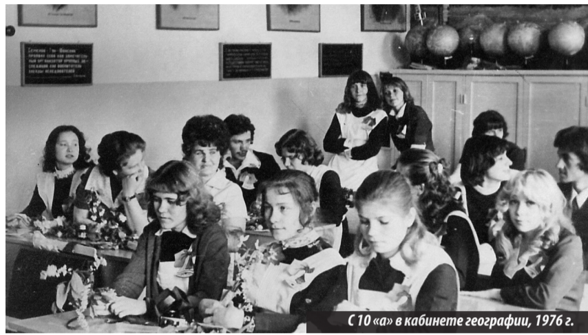
С 10 «а» в кабинете географии, 1976 г.

классной работы и 12 лет — директором школы. «С удовольствием вспоминаю годы работы в школе №2, всегда идущей в ногу со временем, активно работающей над повышением качества образования. С первых же дней я была очарована ат-