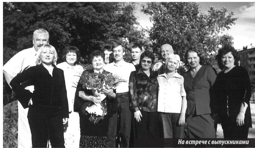
На встрече с выпускниками

эlegantная женщина хоть раз повысила голос или допустила небрежность при подготовке к уроку. Даже записи на доске радовали глаз. Не удивительно, что для своих учеников она всегда оставалась образцом.