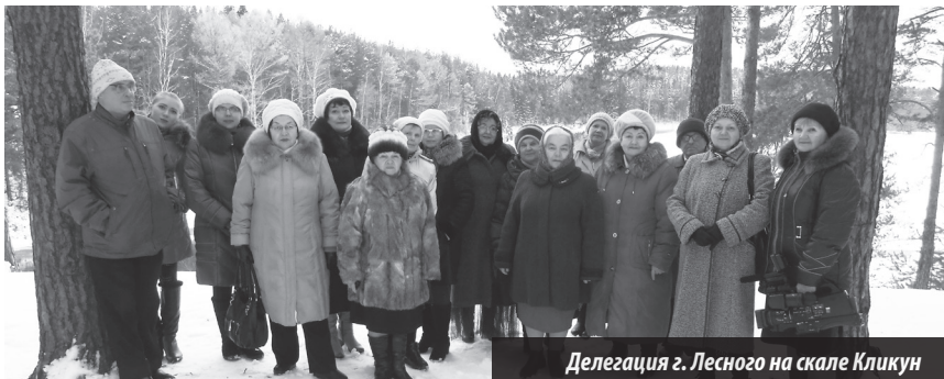
Делегация г. Лесного на скале Кликун

В гостях у поэтического объединения «Кликун»