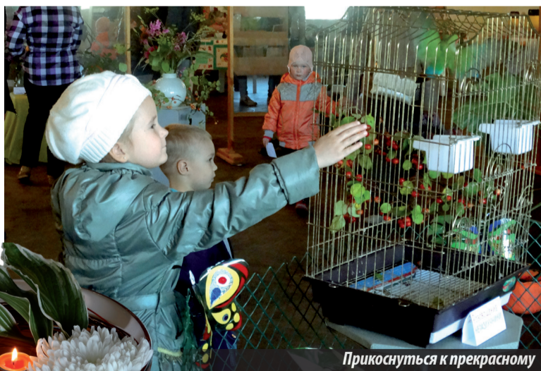
Прикоснуться к прекрасному

Пришедшие полюбоваться на результат союза человека и природы попадали в удивительный мир изыщества. Солнечные зайчики, проникавшие в зал через большие окна, игриво перепрыгивали с одного экспоната на другой, словно ведя экскурсию и призывая обратить внимание на тот или иной момент в композиции. Красочные экспонаты привлекали взгляды и настраивали на лирический лад. Каждая работа была оформлена интереснейшим, оригинальным образом. Некоторые композиции сопровождалась стихотворными четверостишиями. Здесь было представлено не только огромное множество разнообразных цветов, но и необычной формы овощей. К примеру, одна картофелина выглядела точь-в-точь как маленький