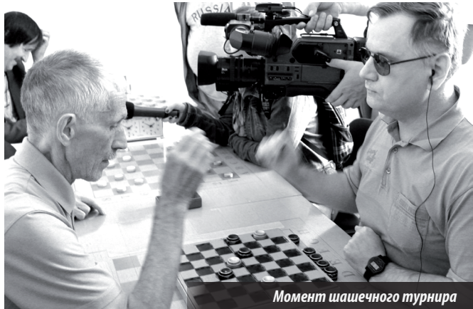
Момент шашечного турнира

СОБСТВЕННО говоря, мероприятия, посвященные этой дате, начались еще на прошедшей неделе, когда мастера настольного тенниса собрались на турнир городов Урала.