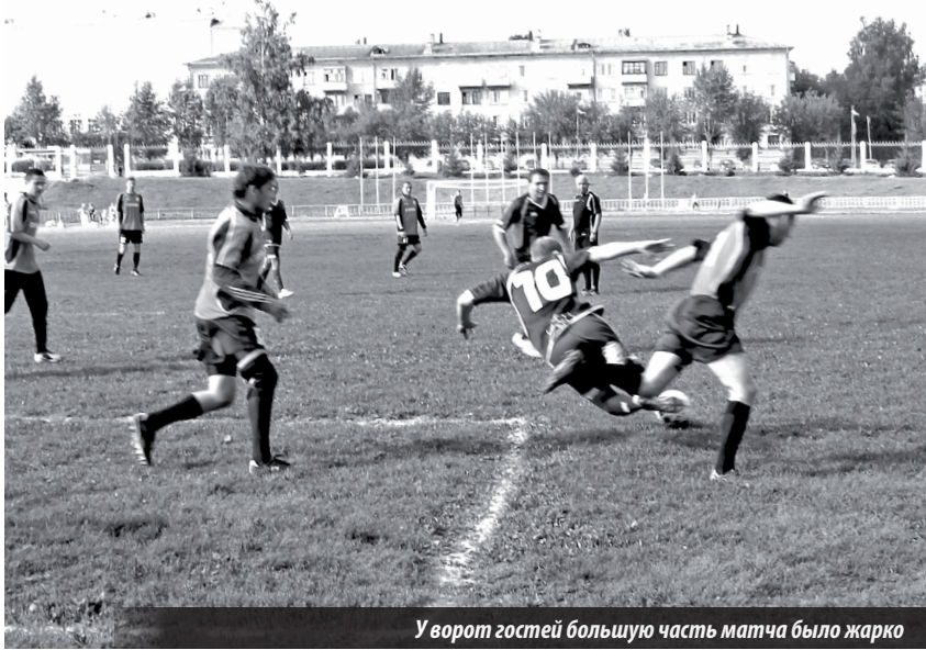
У ворот гостей большую часть матча было жарко

Первенство Северного округа Свердловской области