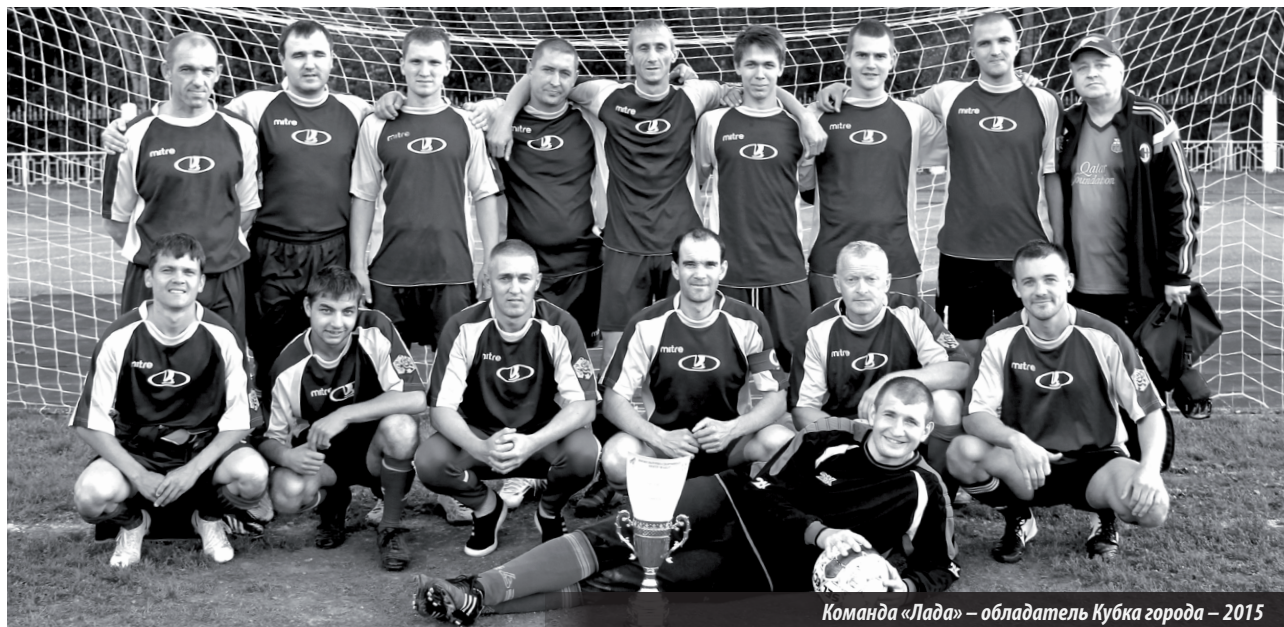
Команда «Лада» — обладатель Кубка города — 2015