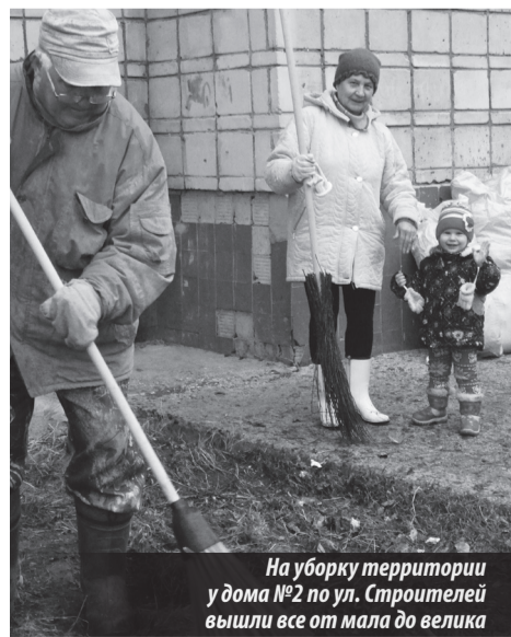
На уборку территории у дома №2 по ул. Строителей вышли все от мала до велика