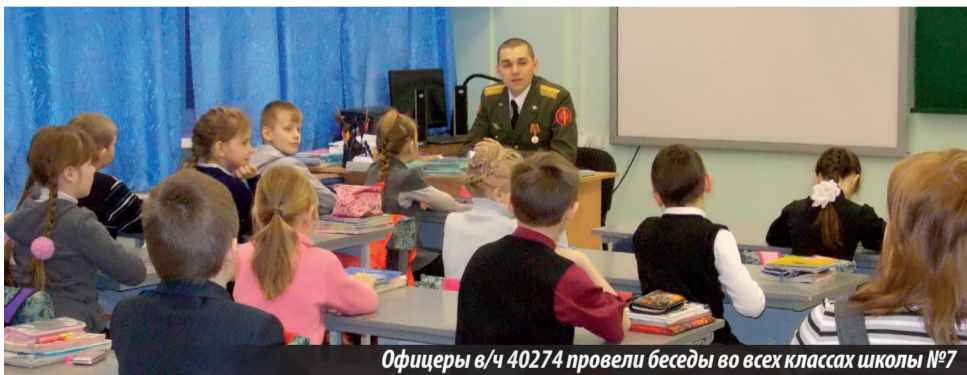
Офицеры в/ч 40274 провели беседы во всех классах школы №7

В Нижней Туре прошел единый «Урок мужества»