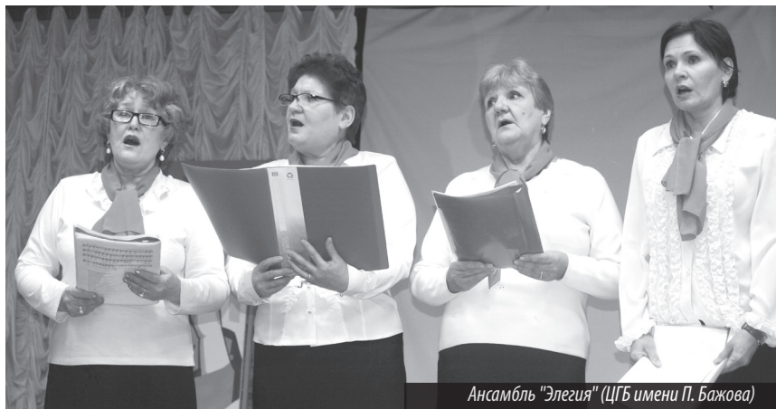
Ансамбль «Элегия» (ЦГБ имени П. Бажова)

Или еще вот такие интереснейшие факты. Бойцы с фронта писали Пав-