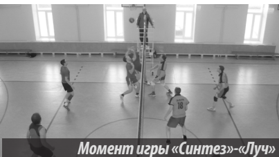
Момент игры «Синтез»-«Луч»

Во встрече ЛПУ МГ «Луч» был показан волейбол более высокого класса. Она осталась за нижегородцами 3:0 (25:20, 25:21, 25:21), гарантировавшими себе место в призовой тройке.