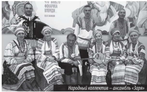
Народный коллектив — ансамбль «Заря»

Татьяна САИТОВА, редактор отдела культуры, г. Лесной