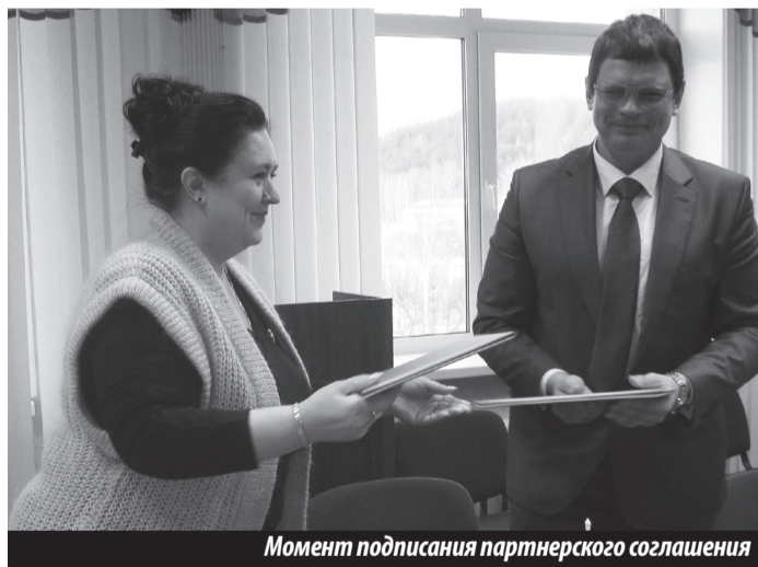
Момент подписания партнерского соглашения

Н. КОЛПАКОВА , пресс-секретарь главы НТГО