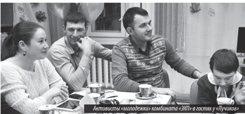
Активисты «молодежки» комбината «ЭХП» в гостях у «Лучиков»

Встреча проходила в формате живого общения, вопросов-ответов детей ТО «Лучики», их родителей и членов Молодежной общественной организации комбината «ЭХП». Представление