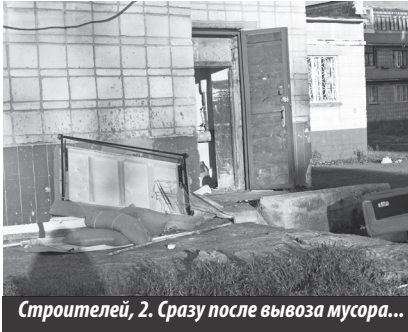
Строителей, 2. Сразу после вывоза мусора...

Возьмем, к примеру, наш дом №2 по улице Строителей, расположен он рядом с центральной вахтой, и с него, можно сказать, наш город и начинается. Это, по сути, его лицо. Но как оно выглядит, судите сами. Уже третий год, как дворовая территория жилого дома превратилась в свалку мусора. За домом, там, где находится бак мусоропровода, к которо-