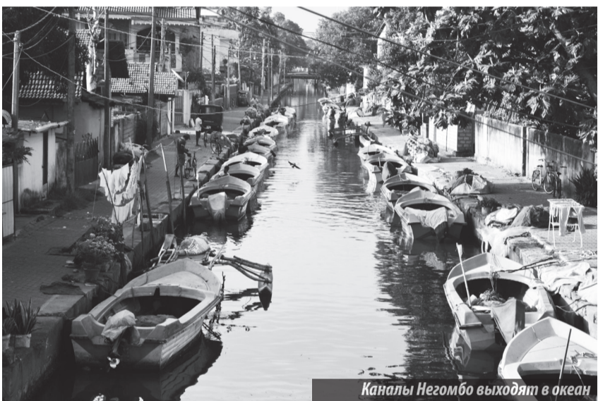
Каналы Негомбо выходят в океан

На острове добывается более 80 видов драгоценных камней, особая гордость Шри-Ланки — сапфиры. В любом ювелирном магазине можно самостоятельно выбрать камни, металл и дизайн будущего украшения, которое будет готово уже вечером или максимум —