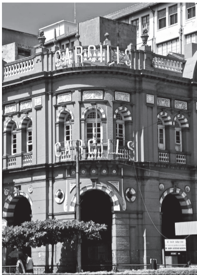
Здание одной из бывших чайных британских компаний в столице Коломбо

Странно, но Шри-Ланка никогда не пользовалась особой популярностью у российских туристов. А зря. Визу мы просто получили в аэропорту Коломбо по прибытию, климат острова даже в так называемый «сезон дождей» был комфортен, а возможности для полноценного отдыха здесь разнообразны. За-