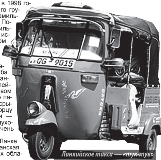
Ланкийское такси — «тук-тук»